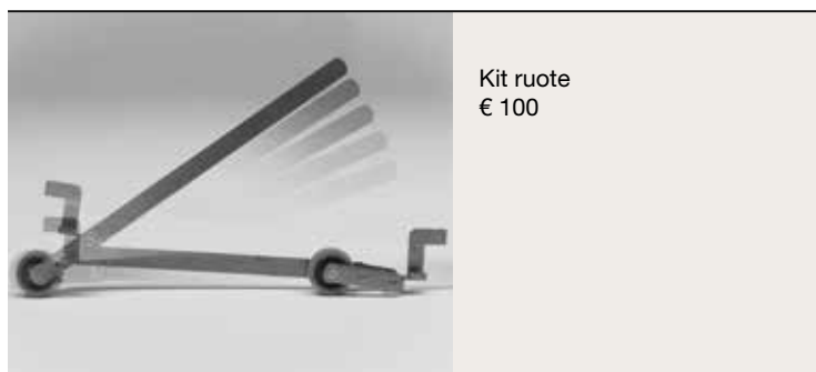
Kit ruote € 100